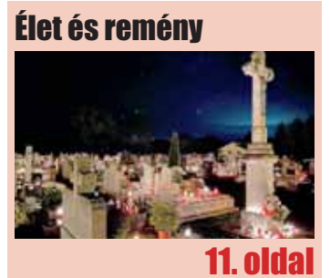
Élet és remény