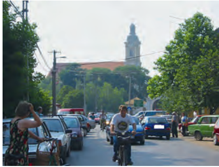
Képünk régi, de a helyzet változatlan!