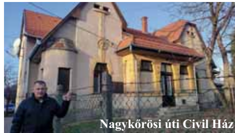
Nagykörösi úti Civil Ház

A Dr. Kostyán Andor Rendelőintézethez tartozó volt Sívó Kúria épületének felújítása, valamint „Civil Ház” felújítása Magyarország